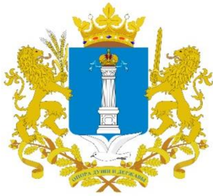
Герб Ульяновской области