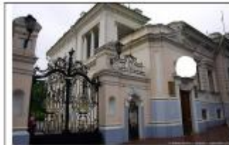
1. Особняк купца Н.Я. Шатрова.