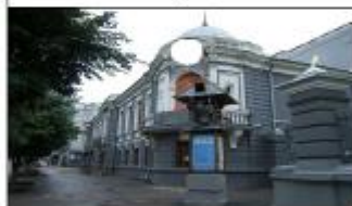
2. Ульяновский театр кукол им. В.М.Леонтьевой