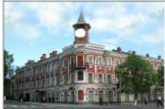
3. Историко-мемориальный центр-музей И. А. Гончарова