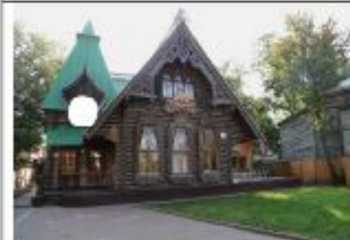
4. Дом-теремок купца_Бокоунина