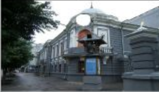
2. Ульяновский театр кукол им. В.М.Леонтьевой