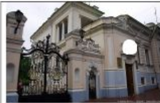
1. Особняк купца Н.Я. Шатрова.