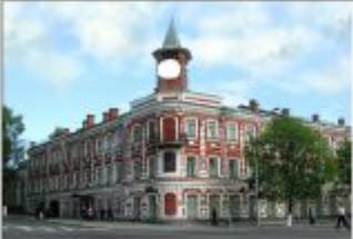
3. Историко-мемориальный центр-музей И. А. Гончарова